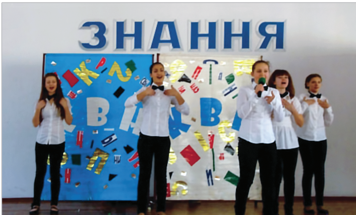
Команда КВК «ННЭН» — переможець районного фестивалю шкільних команд 2011—2012 років

рівні. Вирішуючи ці завдання, школа забезпечує різні види діяльності в широкому спектрі позакласної сфери: гуртковій, профільній, спортивній, художньо-естетичній роботі, максимально сприяючи розвитку кожної дитини як особистості.